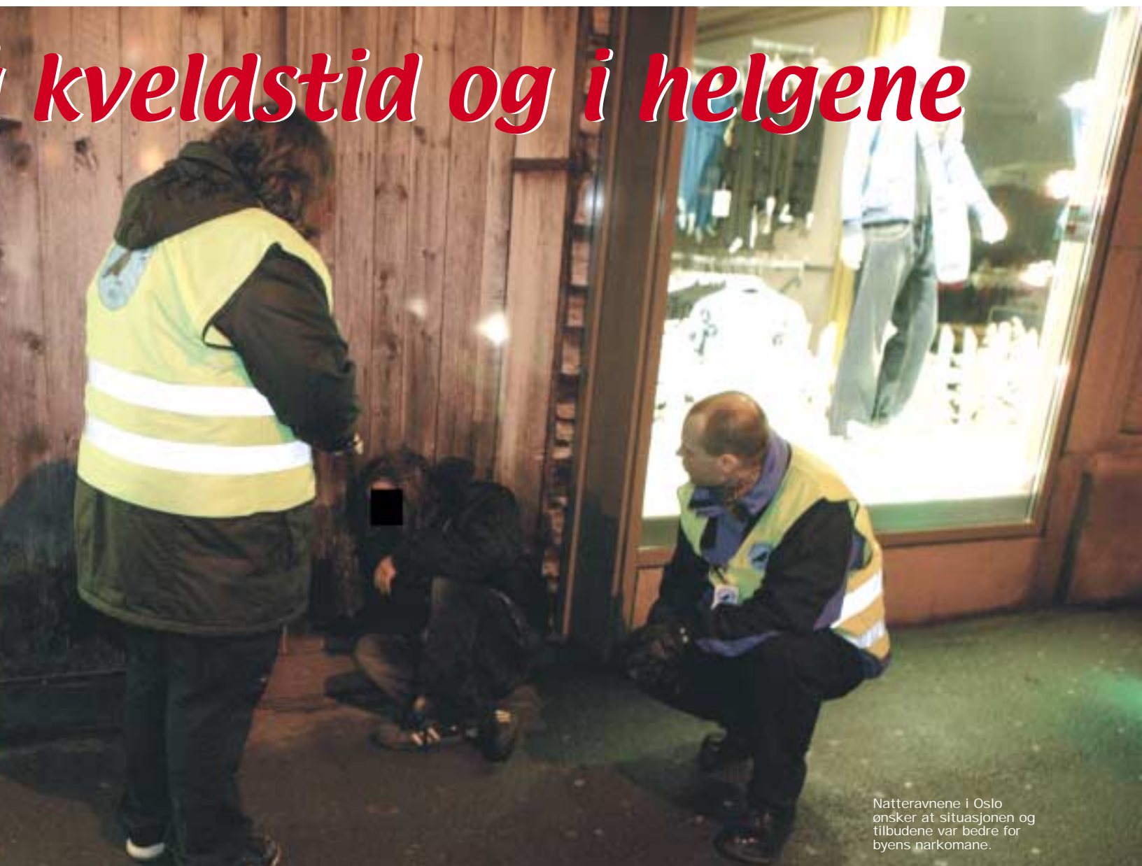
Natteravnene i Oslo ønsker at situasjonen og tilbudene var bedre for byens narkomane.

tilfeller hvor de ikke kommer frem på 112, i tillegg til at politiet ikke lenger er tilstede i bybildet på nattetid slik de var før, sier Norbom.