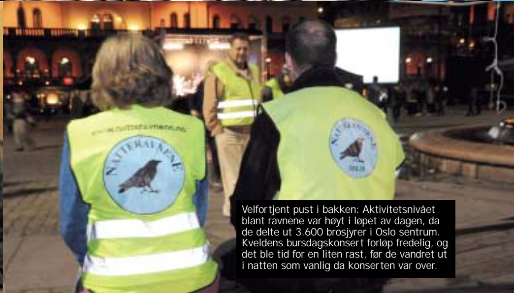
Velfortjent pust i bakken: Aktivitetsnivået blant ravnene var høyt i løpet av dagen, da de delte ut 3.600 brosjyrer i Oslo sentrum. Kveldens bursdagskonsert forløp fredelig, og det ble tid for en liten rast, før de vandret ut i natten som vanlig da konserten var over.