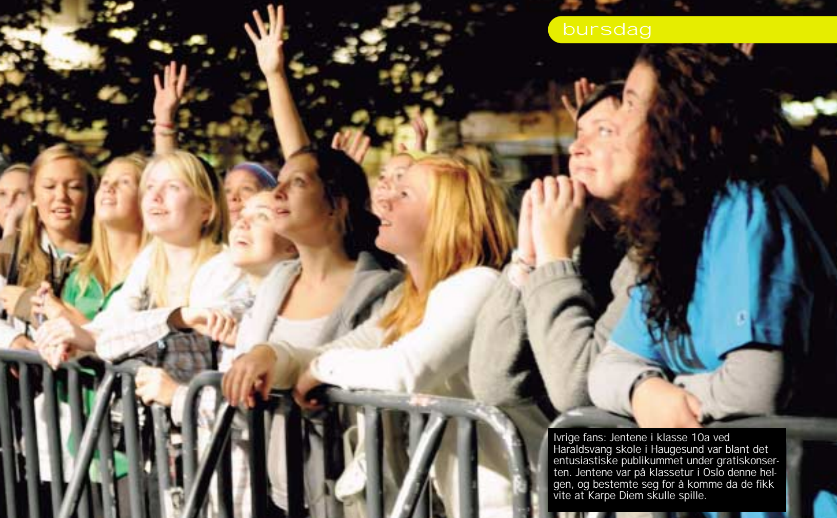
Ivrige fans: Jentene i klasse 10a ved Haraldsvang skole i Haugesund var blant det entusiastiske publikummet under gratiskonserten. Jentene var på klassetur i Oslo denne helgen, og bestemte seg for å komme da de fikk vite at Karpe Diem skulle spille.