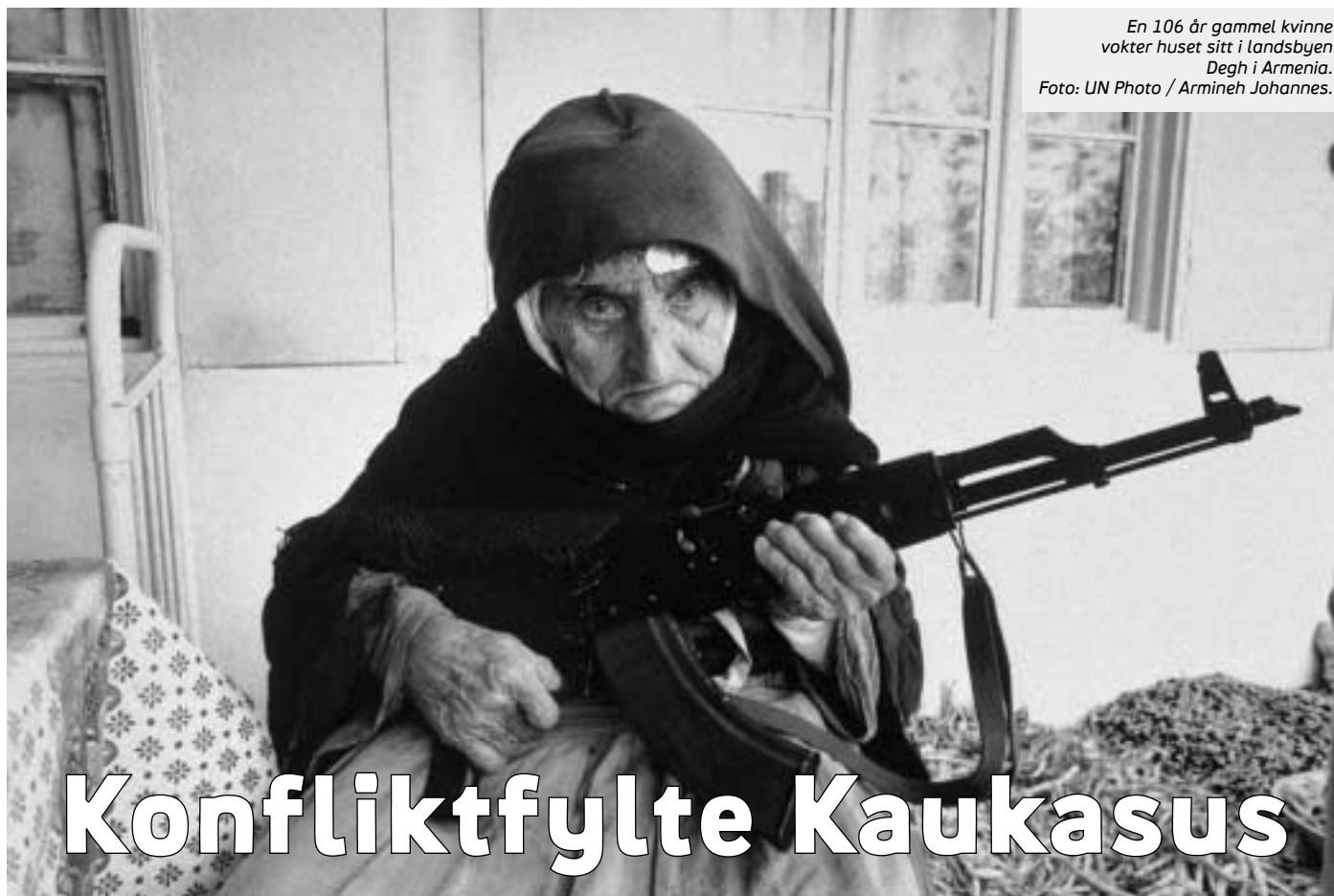
En 106 år gammel kvinne vokter huset sitt i landsbyen Degh i Armenia.